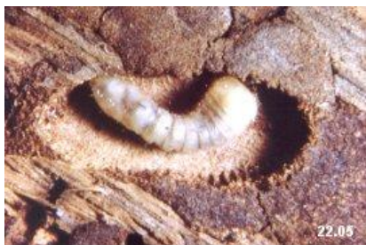
Bild: Larve eines Veränderlichen Scheibenkäfers

Der veränderliche Scheibenkäfer befällt kranke, bereits abgestorbene oder schon gefällte, Laubbäume. Die Weibchen legen ihre Eier bevorzugt an berindetes, hartes Laubholz. Dabei werden Eichen, Buchen und Obstbaumarten bevorzugt. Die Larven entwickeln sich zwischen Rinde und Holz und bohren sich zur Verpuppung in die äussere Holzschicht ein.